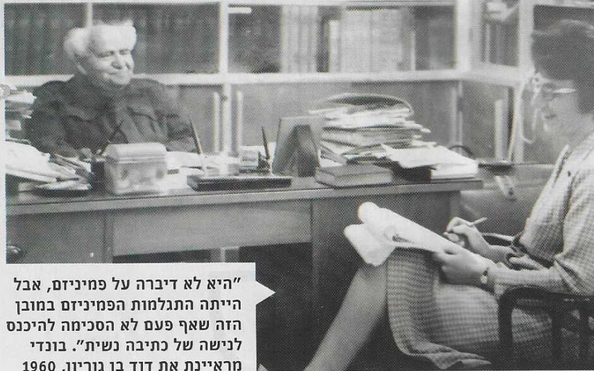
"היא לא דיברה על פמיניזם, אבל הייתה התגלמות הפמיניזם במונח הזה שאף פעם לא הסכימה להיכנס לנישה של כתיבה נשית". בונדי מראיינת את דוד בן גוריון, 1960